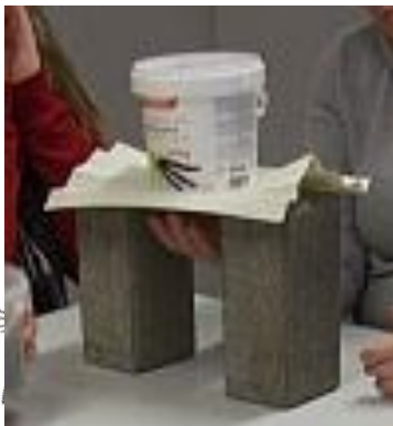
Stabilität von Falten und Knicken

Die Ideen aus der Natur zu nutzen, um daraus zukunftsweisende Technologien zu entwickeln, ist Bestandteil der Wissenschaft „BIONIK“ ( Biologie/Technik ).