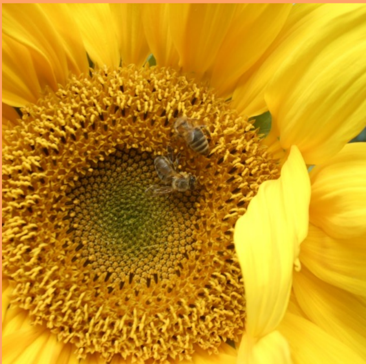
Honigbienen auf Nahrungssuche